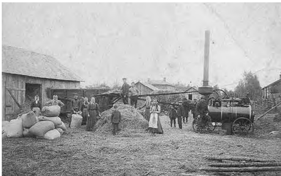
"Trösking förr i tia"

Även detta från häftet "Ett tjög småbeter frå Kalsta bonn-distreckt"