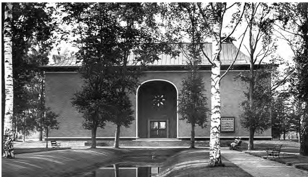
"Maja i Daln" kom aldrig hit till Värmlands museum